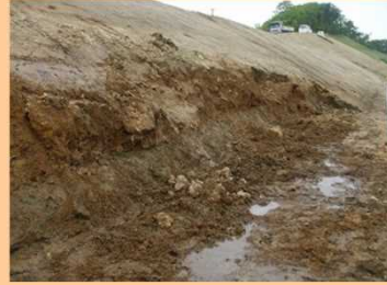
盛土法尻部の表層崩壊