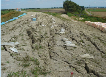
築堤盛土のすべり崩壊