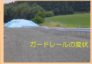
ガードレールの変状