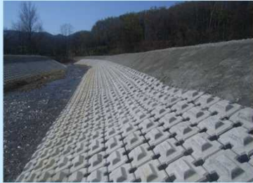
護岸ブロックの変状