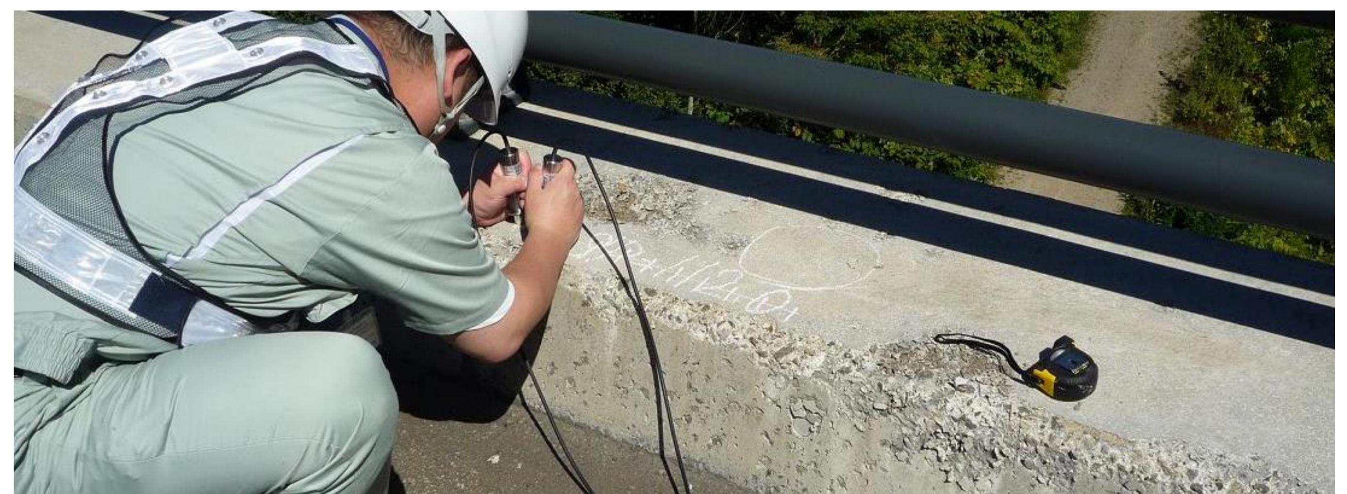
写真-1 点検状況(道路橋) 測定点数は8点/箇所