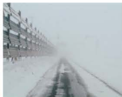
▲吹き払い式防雪柵