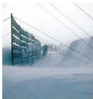
▲吹きだめ式防雪柵

積雪寒冷地における道路では、吹雪による視程障害や吹きだまりが冬期道路交通の大きな障害となっています。そのため、これまでに道路上の吹雪対策のため防雪柵などの整備が進められてきました。防雪柵には主に吹きだめ式、吹き払い式、吹き止め式の3種類があります。このうち吹き止め式防雪柵は、下部間隙を無くし、空隙率を低く、かつ柵高を高くしたもので、主に柵の風上に吹雪を堆雪させ、道路上の風速の低下と吹雪量の減少をもたらすことにより、吹きだまりと視程障害を緩和するもので、寒地土木研究所では吹雪対策としての防雪柵について研究を行っています。