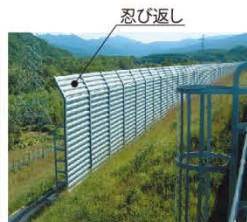
▲吹き止め式防雪柵