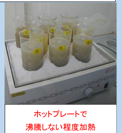
ホットプレートで沸騰しない程度加熱