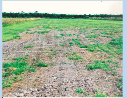
酸性硫酸塩土壌による牧草の生育障害状況

圃場内に酸性硫酸塩土壌を撒き出してしまった結果、pHが3程度まで低下し、牧草の生育に障害が出た。