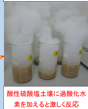
酸性硫酸塩土壌に過酸化水素を加えると激しく反応