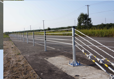
▲ワイヤロープ式防護柵

しかし、依然としてスリップ等の事故は後を絶ちません。そこで、鋼製防護柵協会と共同研究により衝撃を緩和する新しい中央分離施設としてワイヤロープ式防護柵を開発しました。