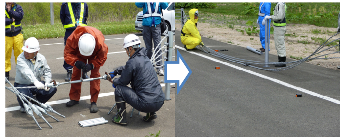
▲支柱は人力で脱着し、開口部を設置

細い支柱にワイヤロープを通してあるので、表裏がなく、設置幅が少なくてすみます。その結果、防護柵設置に伴う工事費用縮減が可能です。