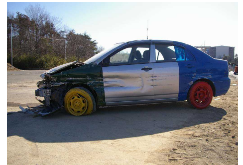
▲乗用車(1トン)のAm種試験 ▲大型車(20トン)のAm種試験 ▲衝突後の乗用車損傷状況

➢防護柵設置基準に定められた実車を防護柵に衝突させる性能確認試験により、平成24年1月には高速自動車・自動車専用道路分離帯用Am種、平成26年3月には一般道路分離帯用Bm種の性能を有することが確認されました。平成29年度から高速道路暫定2車線区間のレーンディバイダーとして急速に普及しました。