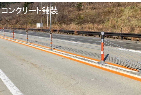
コンクリート舗装