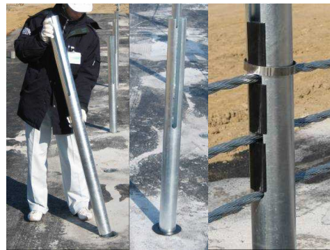
▲支柱を建込み、ワイヤロープと間隔保持材を取り付ける。