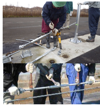
▲索端金具とターンバクルを装着し、張力を調整する。