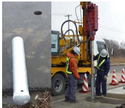
▲舗装にスリーブを打ち込む。