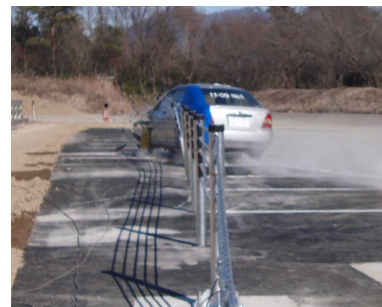
▲車両が受ける衝撃を緩和

車両衝突時に中間支柱が倒れ、ワイヤロープのたわみが車両の衝撃を緩和して、安全に誘導します。従来の防護柵と比べて、乗員が受ける衝撃が小さくなるので高い安全性が確保されます。