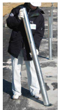
▲破損した支柱を取り外し、スリーブに挿入