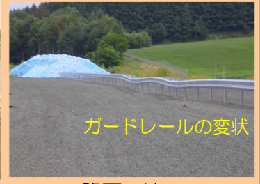
ガードレールの変状