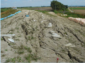
築堤盛土のすべり崩壊