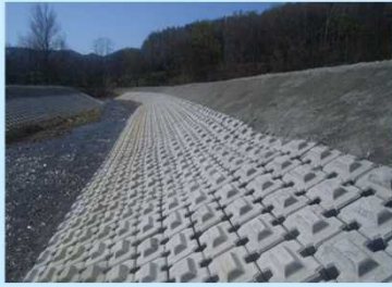
護岸ブロックの変状