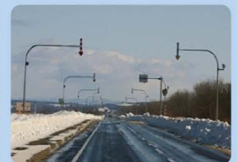
固定式視線誘導柱(矢羽根)