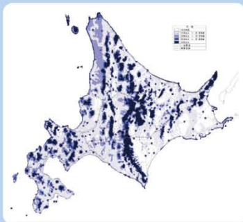
視線障害頻度分布図